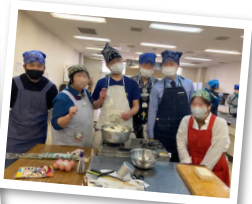
調理前の記念撮影