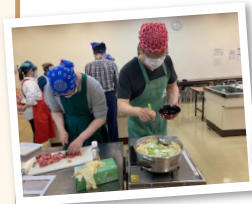
作業を分担しての調理

阿賀まちづくりセンターの調理室をお借りして「お味噌汁や卵焼き」作りを行いました。事前にどんな具材が必要なのか、費用はどれくらいかかるのか、皆で得意なこと苦手なことを話し合い、役割分担を決めて効率的に進めることが出来るようスタッフも協力しながら調理に臨みました。自分の役割だけでなく困っている人を手伝ったりと調理実習を通して、皆で協力して一つの事をやり遂げる達成感や役割分担で作業を効率化する大切さを理解でき、コミュニケーションもたくさんとれて良い調理実習となりました。自分たちで一生懸命頑張ったかいあって、とても美味しかったです。