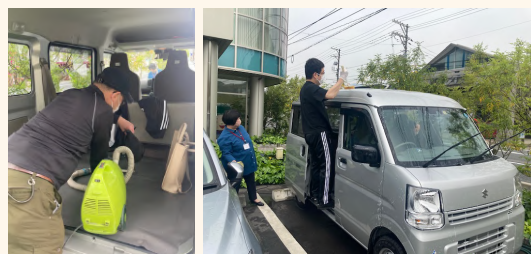
▲写真は掲載許可を頂いた洗車作業の様子

ピカピカになった車を見た依頼者に感謝されてとてもやりがいを感じたとご感想を頂きました。