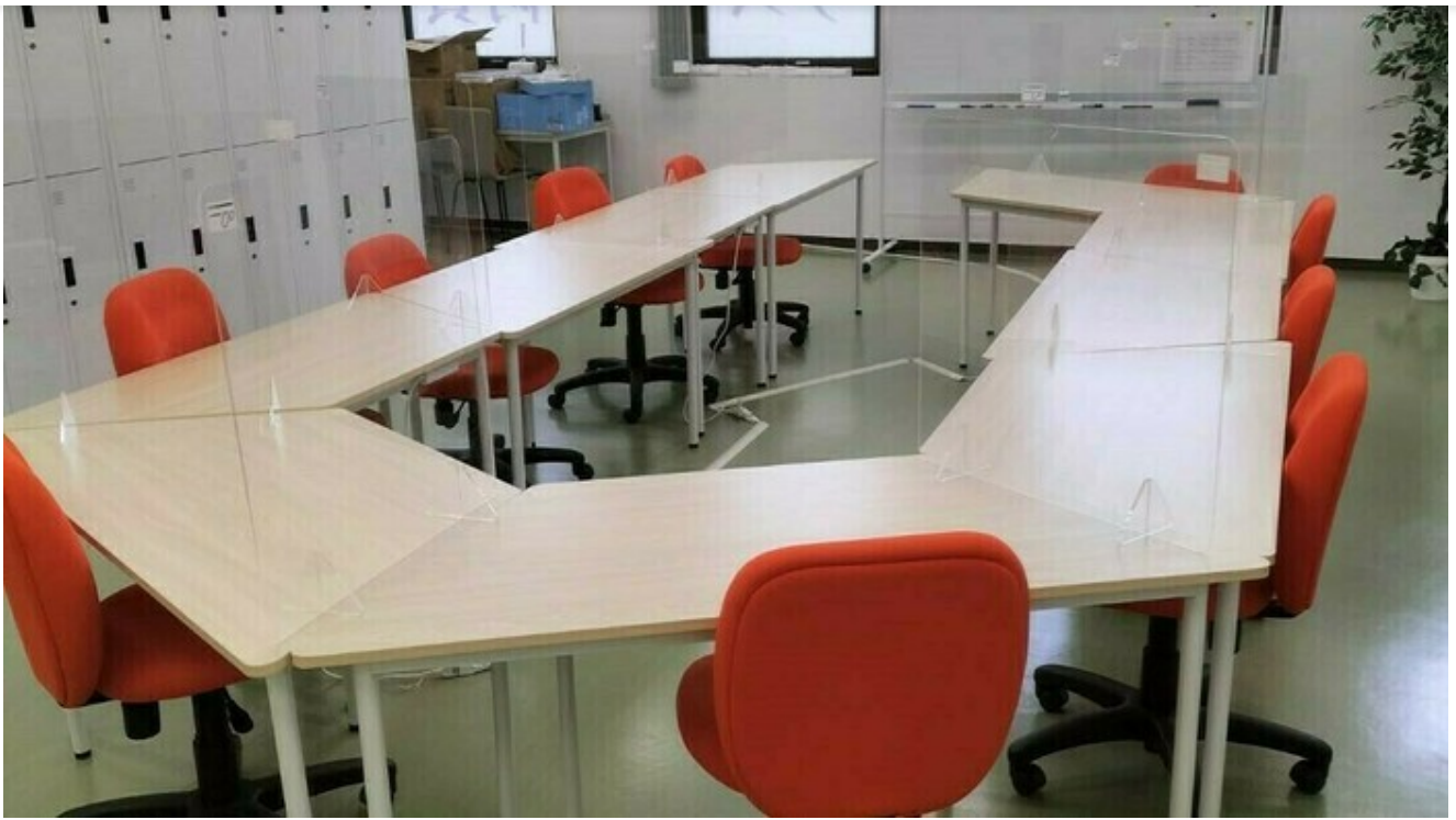
アクリルパネルによる飛沫対策（利用者さんスペース）