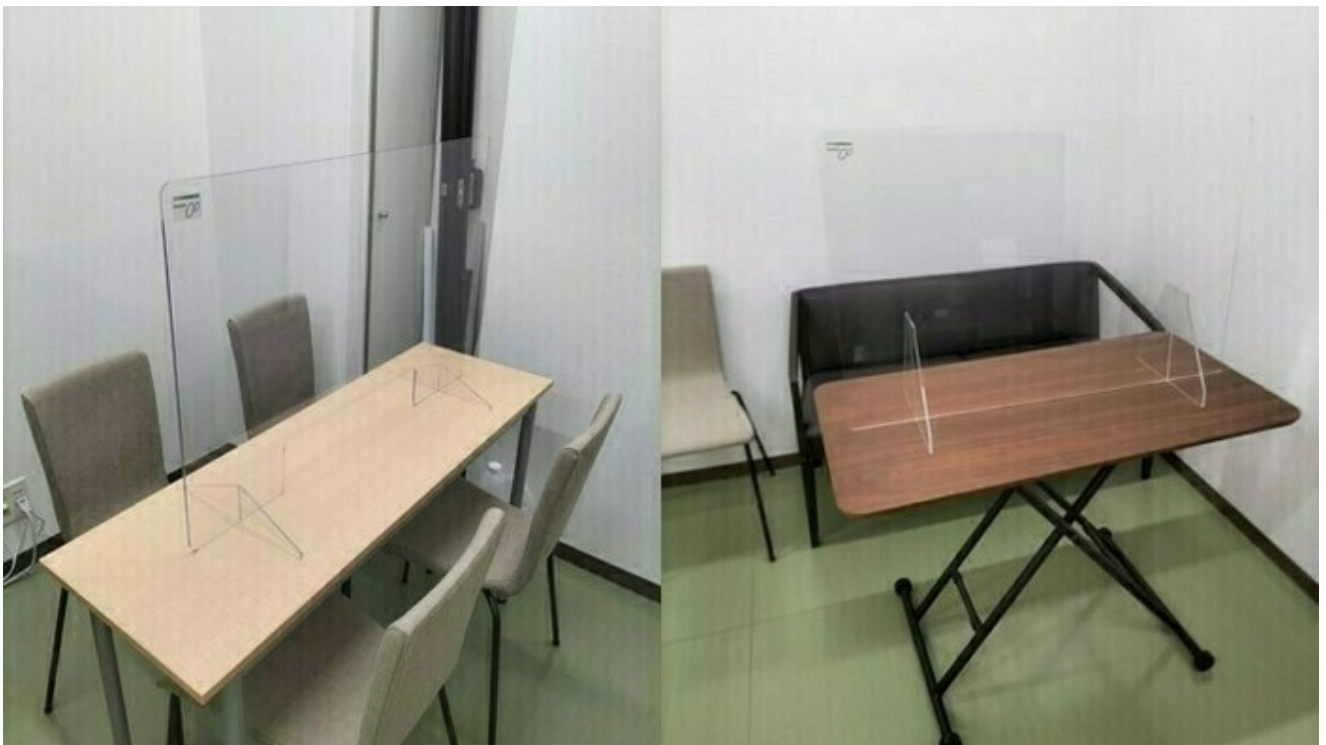
相談スペース・リラックススペースにもアクリルパネルを配置